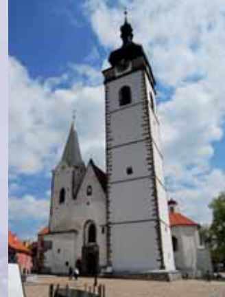
Západní průčelí kostela P. Marie. Fotografie z roku 2010.

Veřejnosti bylo ochoz věže znovu zpřístupněn po provedení úprav včetně umístění pletiva na ochozu v srpnu 2009. Vstup je možný ve skupinách do maximálně 10 osob a s technickým doprovodem, z těchto důvodů je potřebné si místa předem rezervovat prostřednictvím www.pisek.eu nebo Infocentra Písek.