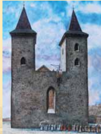
Západní průčelí kostela P. Marie v průběhu jeho újstaoby počátkem druhé poloviny 13. století. Namaloval Libor Balák v roce 2010.

Za dobu své existence věž pamatuje jediného sebevraha z r. 1939. Mladý zubní laborant si tehdy vypůjčil zlato pro výrobu prstenu pro svou milou. Bohužel, než je stihl vrátit, bylo chybějící zlato kontrolou zjištěno. Pod tíhou událostí se mladík rozhodl vzít si život, přičemž místo dopadu zvolil mimo dole probíhající trh. Za jeho ohleduplnost je místo jeho skonu označeno červenými kameny v podobě kapky krve.