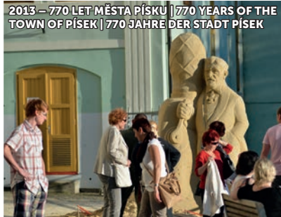
2013 – 770 LET MĚSTA PÍSKU | 770 YEARS OF THE TOWN OF PÍSEK | 770 JAHRE DER STADT PÍSEK