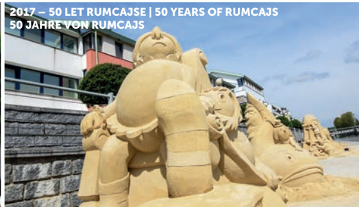
2017 – 50 LET RUMCAJSE | 50 YEARS OF RUMCAJS 50 JAHRE VON RUMCAJS