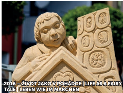
2016 – ŽIVOT JAKO V POHÁDCE | LIFE AS A FAIRY TALE | LEBEN WIE IM MÄRCHEN