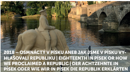
2018 – OSMNÁCTÝ V PÍSKU ANEB JAK JSME V PÍSKU VY- HLAŠOVALI REPUBLIKU | EIGHTEENTH IN PÍSEK OR HOW WE PROCLAIMED A REPUBLIC | DER ACHTZEHNTE IN PÍSEK ODER WIE WIR IN PÍSEK DIE REPUBLIK ERKLÄRTEN