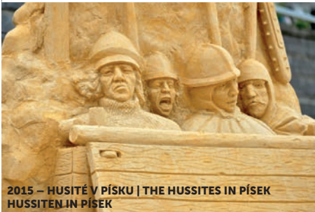
2015 – HUSITÉ V PÍSKU | THE HUSSITES IN PÍSEK HUSSITEN IN PÍSEK