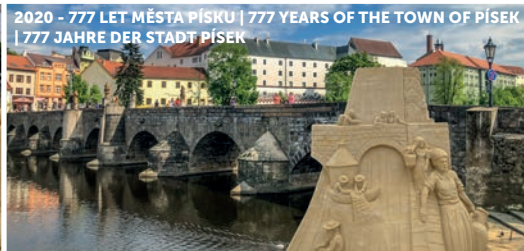
2020 – 777 LET MĚSTA PÍSKU | 777 YEARS OF THE TOWN OF PÍSEK 777 JAHRE DER STADT PÍSEK