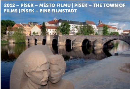
2012 – PÍSEK – MĚSTO FILMU | PÍSEK – THE TOWN OF FILMS | PÍSEK – EINE FILMSTADT