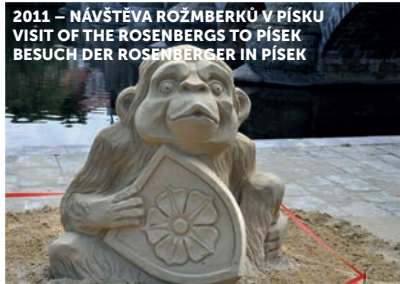
2011 – NÁVŠTĚVA ROŽMBERKŮ V PÍSKU VISIT OF THE ROSENBERGS TO PÍSEK BESUCH DER ROSENBERGER IN PÍSEK